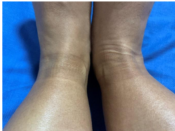
Figura 4. Presión de las medias en el cuello del pie luego de un turno de 12 horas en la UCI - COVID donde el personal de la salud debe utilizar EPP especial.