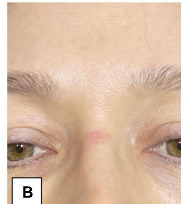
Figura 3A. Máscara protectora utilizada por el personal de salud en contacto con pacientes hospitalizados en la UCI- COVID. 3B. Eritema leve en el sitio de contacto con este dispositivo.