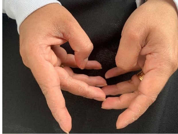
Figura 1. Descamación secundaria al lavado frecuente de manos en personal de la salud.