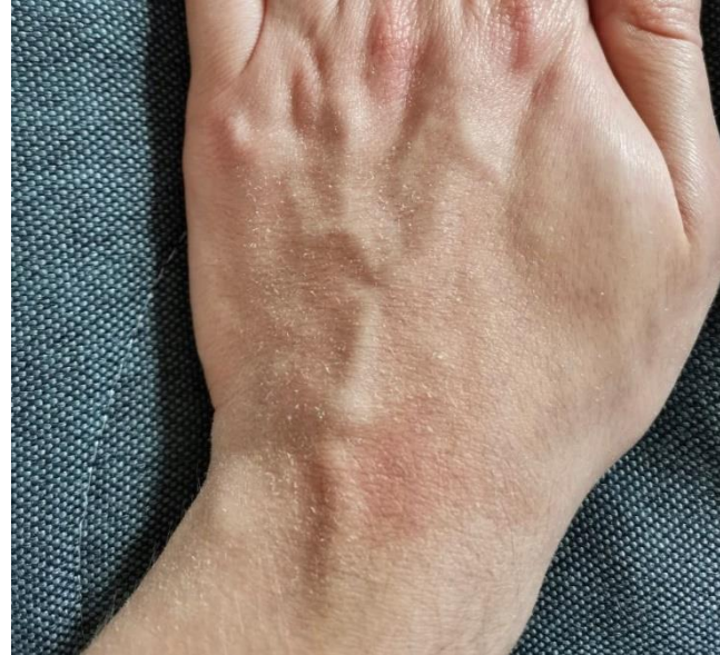
Figura 5. Xerosis con descamación superficial secundaria al lavado frecuente de las manos.